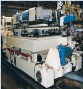
コイルカー (リフト式)