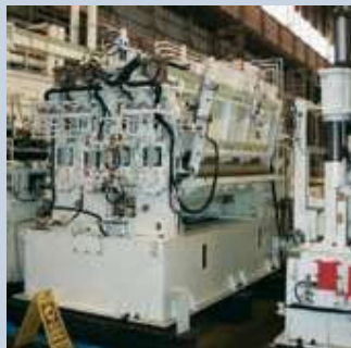
洗浄装置、ダウンカットシャー、コイル先端矯正